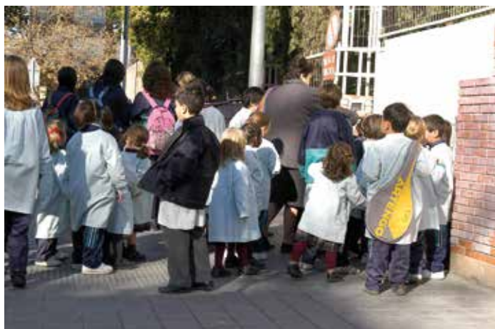
La FEMP pedirá revisar también determinados servicios en materia de educación.

Sin embargo, el Anteproyecto les da otras potestades como la del control de la eficacia de los servicios que prestan los Gobiernos Locales que, según el Alcalde de Santander, "se parece bastante a lo que pueden ser factores de oportunidad" que, a su juicio, "deben residir siempre en el ámbito político" . En este sentido, puntualiza que hay determinados aspectos en el papel que van a jugar los interventores a partir de la reforma que son de "dudosa compatibilidad con la autonomía local". ★