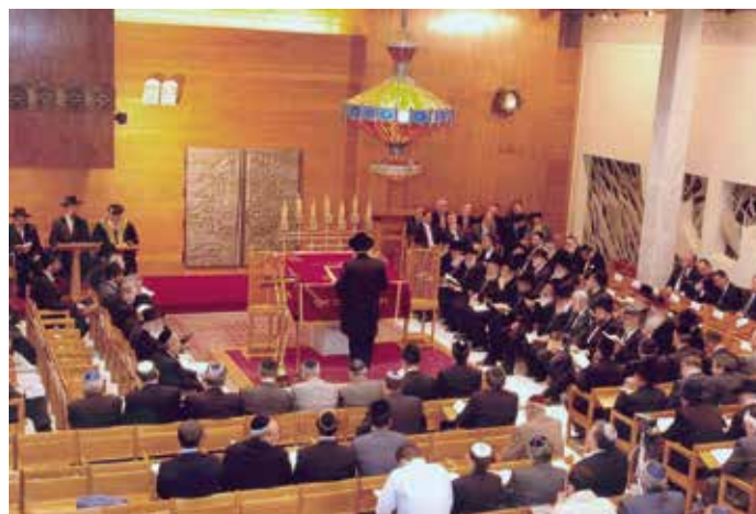
La Guía aborda las demandas y usos más habituales en relación con las actividades de las distintas confesiones religiosas.

El cuarto bloque trata los aspectos de la manifestación del culto relacionados con la protección del medio ambiente, en concreto la contaminación acústica y, finalmente, el quinto apartado explica la rotulación de los lugares de culto en tanto que los requisitos necesarios para anunciar los lugares de culto constituyen una materia que incide en la vía pública.