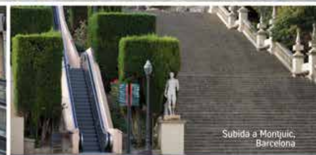
Subida a Montjuic, Barcelona