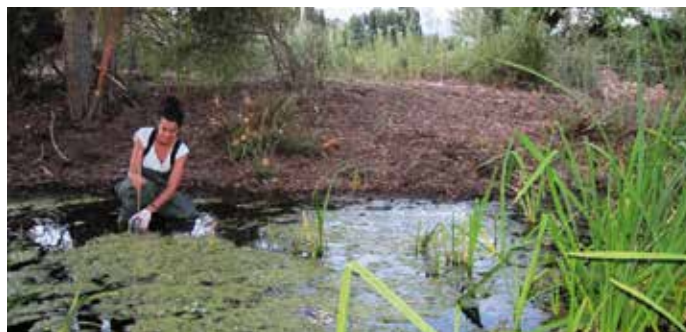
El concurso propone la restauración de puntos de agua para que cumplan su función como hábitat de anfibios.

WWF ha editado un amplio folleto explicativo para que sirva de guía orientativa a las Entidades Locales que decidan presentar un microproyecto al concurso. Contiene una colección de ideas y ejemplos de actuaciones que se han realizado en distintos lugares y en el marco de otros proyectos, que han tenido éxito tanto a nivel de conservación como a nivel de sensibilización ambiental. ★