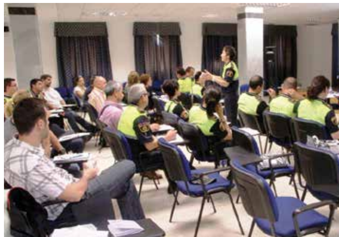
Cursos de formación de policías locales, en el marco del proyecto HERA de Valencia.