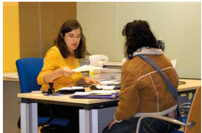
Los servicios sociales municipales adquieren un especial protagonismo en el proceso de adjudicación de las viviendas

El fondo cuenta con un total de 5.891 viviendas destinadas al alquiler, aportadas por 33 entidades financieras. A estos alojamientos pueden acceder personas que hayan sido desalojadas de su primera vivienda a partir del 1 de enero de 2008 y que, además, se encuentren en situación de especial de vulnerabilidad social.