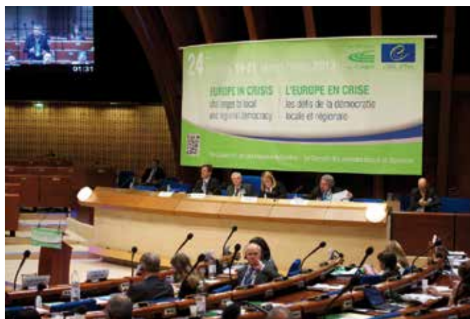
Imagen del Plenario del pasado marzo, en el que se debatió el informe sobre la autonomía local en España.

Así, entre otras cuestiones, el Presidente de la FEMP recalcó que el Anteproyecto de Ley viene a clarificar las competencias de las Entidades Locales y a evitar duplicidades; que va a contribuir a la racionalización de la estructura de la Administración Local y a favorecer que las Entidades Locales cumplan con los objetivos de estabilidad y sostenibilidad financiera.