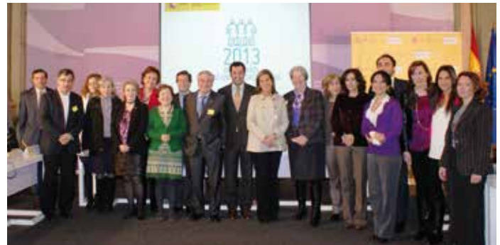
Participantes en el acto del Día Internacional de las Enfermedades Raras.

Desde el ámbito científico, se va a fomentar el desarrollo de líneas de investigación sobre enfermedades raras; se creará un registro epidemiológico único, en colaboración con el Instituto de Salud Carlos III, para alcanzar una gestión más coordinada de este tipo de enfermedades; y se convocará un gran Congreso Nacional Científico, alrededor del mes de octubre de este año, en el que se darán cita los mayores expertos nacionales e internacionales en la materia, con el objetivo de compartir los principales avances en investigación.