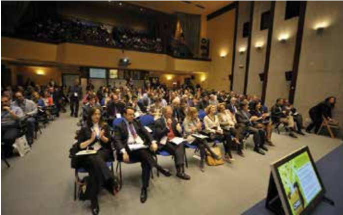
Participantes del congreso.

Para el Presidente de la FEMP las ciudades son un motor de desarrollo al impulsar, mediante la colaboración público privada, un sector que sigue creando empleo