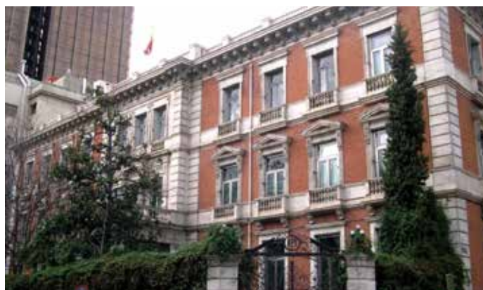
El Ministerio de Hacienda y AAPP remitió el borrador al Consejo de Ministros el pasado 8 de marzo.

La Vicepresidenta del Gobierno anunció que, tras el informe del Ministerio de Hacienda, el borrador pasará por la Comisión de Secretarios de Estado y Subsecretarios para que los informes pertinentes sean remitidos al Consejo de Ministros lo antes posible. ★