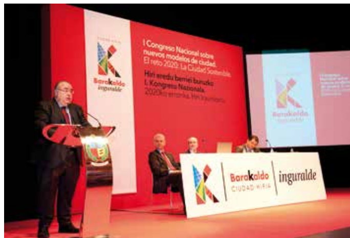
El Alcalde de Barakaldo, Tontxu Rodríguez, durante su presentación en el Congreso sobre Nuevos Modelos de Ciudad.

En sus páginas se sugieren una serie de pasos a seguir para que la aplicación de la filosofía 'ciudad inteligente' sea viable en todos los municipios. Asimismo, incluye las experiencias exitosas realizadas en Europa y proporciona balances de los estudios realizados hasta ahora.