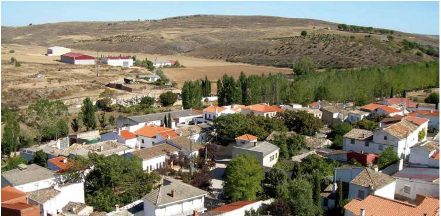
Las alegaciones de la FEMP recogen la defensa de los pequeños municipios.

La Federación ha elaborado un primer borrador de documento de alegaciones que ha trasladado a sus órganos de gobierno para que hagan sus aportaciones y observaciones y así tratar de cerrar un documento definitivo, lo más consensuado posible, en la próxima Junta de Gobierno.