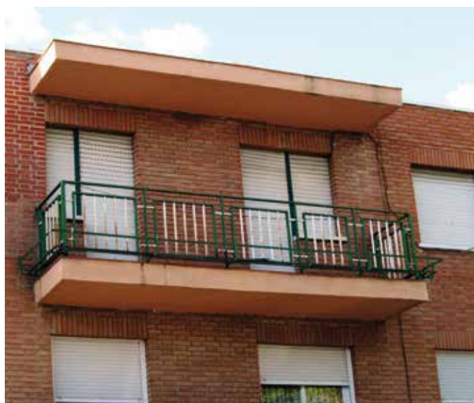
El fondo cuenta con un total de 5.891 viviendas para alquilar, aportadas por 33 entidades financieras.