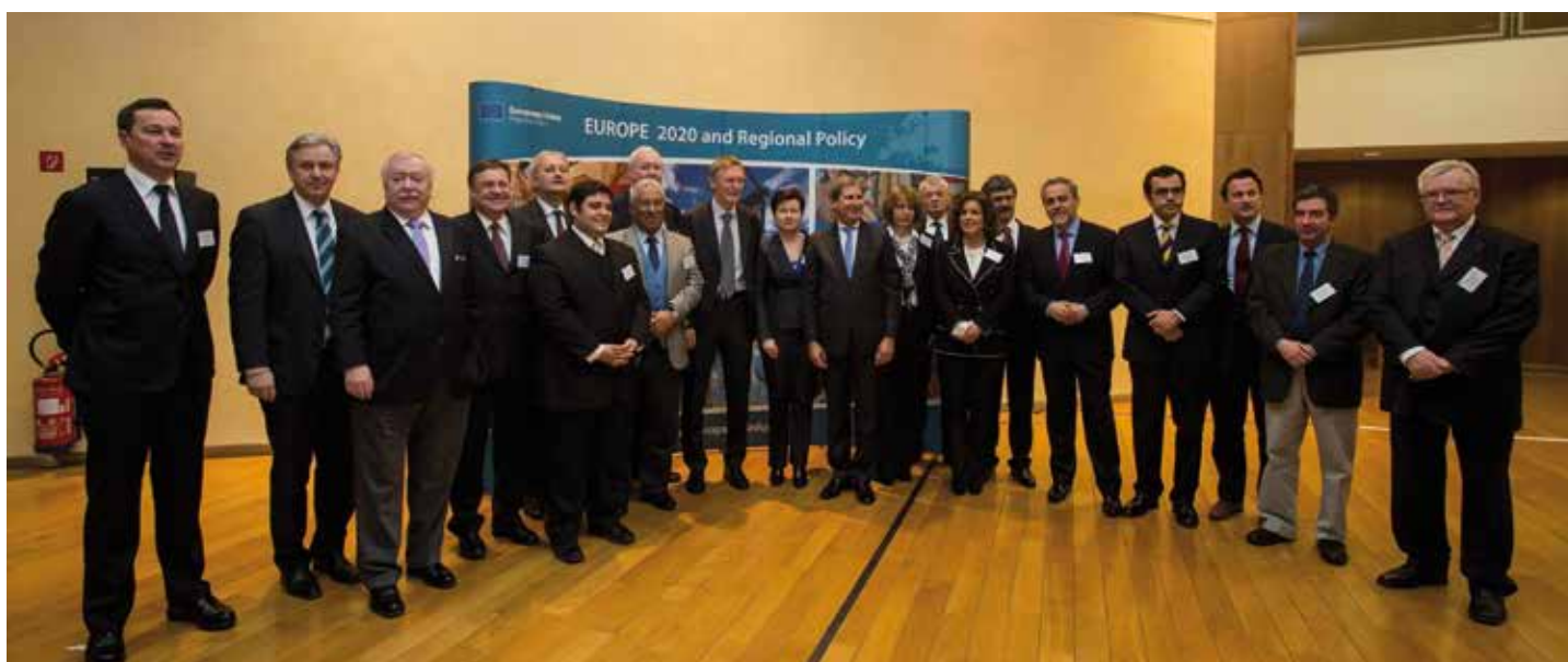
Los Alcaldes participantes junto al Comisario Hahn.

Las ciudades capitales de los Estados de la Unión Europea desempeñan un papel insustituible en el bienestar del territorio de la UE y de sus países. Así quedó constatado el pasado febrero tras el encuentro que veinte Alcaldes de otras tantas capitales comunitarias mantuvieron con el Comisario Europeo de Política Regional, Johannes Hahn, que pidió su colaboración para sacar a Europa de la crisis. La respuesta de los Alcaldes, plasmada en una declaración final, compila las reivindicaciones de éstas como socios imprescindibles.