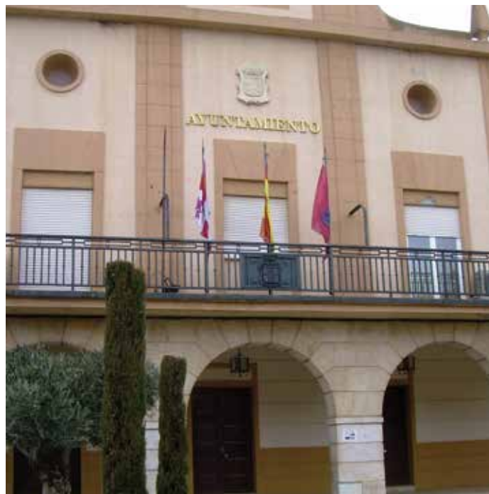
La evolución a la baja de la deuda ha sido la tónica general de las Entidades Locales. En la foto, fachada del Ayuntamiento de Dueñas (Palencia).

La deuda total de las Administraciones Públicas, estimada de acuerdo con los criterios del Protocolo de Déficit Excesivo, alcanzó en diciembre de 2012 un saldo de 884.416 millones de euros. En términos del PIB, la ratio de deuda se situó el pasado ejercicio en el 84,1%. ★