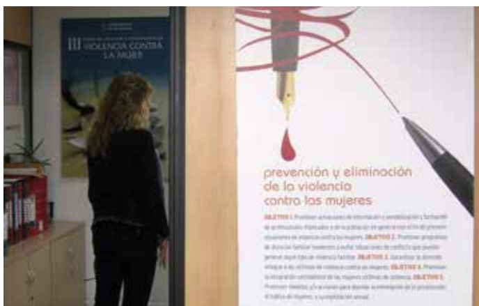
Centro de Igualdad del Ayuntamiento de Santander.