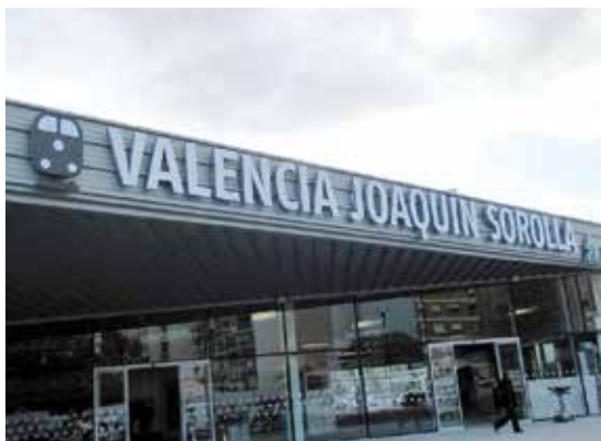
Estación AVE de Valencia.

La Red de Ciudades AVE celebró el 12 de marzo, en Valencia, su asamblea anual, en la que se acordó firmar convenios de colaboración con las Comunidades Autónomas de Andalucía, Aragón, Castilla-La Mancha, Castilla y León y la Comunidad Valenciana. Cataluña y Madrid están pendientes.