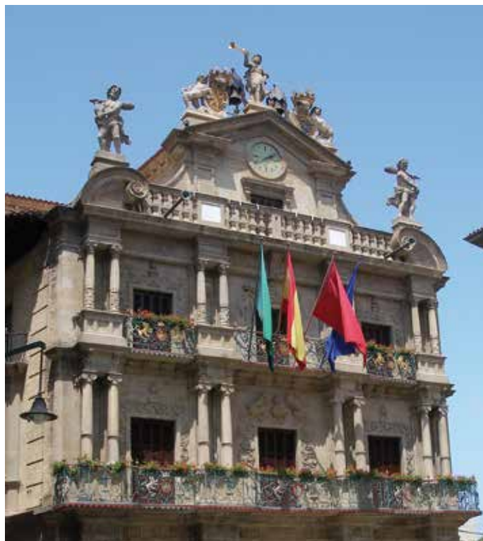
Ayuntamiento de Pamplona.

Según los datos publicados por el Ministerio, estas medidas de financiación puestas a disposición del tejido empresarial, han permitido la creación o el mantenimiento de 174.542 empleos, así como un aumento del nivel del PIB de 1,3%. Además, ha contribuido a la reducción del periodo de pago, otro factor de interés para las empresas. ★