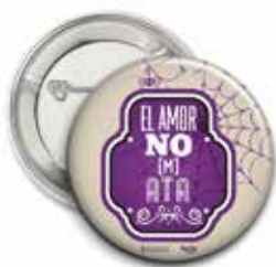
Chapa de la campaña de prevención de actitudes sexistas en educación, del Ayuntamiento de Castrillón. Imagen del Plan de Portugalete, a la derecha.