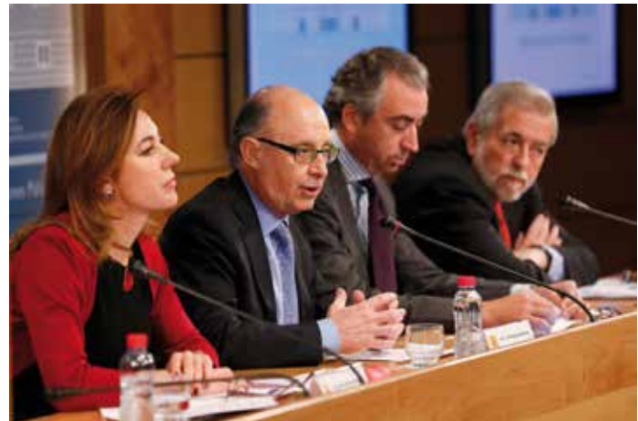
El Ministro Cristóbal Montoro hizo públicos los datos el pasado 28 de febrero.

El Alcalde de Santander mostró su satisfacción porque el Estado en su conjunto haya cerrado 2012 con un déficit del 6,74% y, al mismo tiempo, destacó que las Corporaciones Locales hayan vuelto a ser la Administración que más y mejor ha cumplido con el objetivo que se le había impuesto.