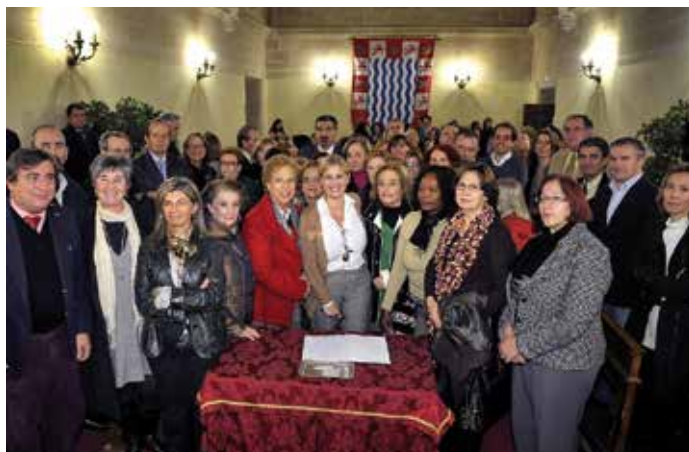
La Alcaldesa de Jerez, en el centro, en la firma de la Declaración Ciudadana por la igualdad y contra la Violencia.

La primera, dirigida a adolescentes y jóvenes en el contexto de la campaña municipal contra la violencia de género, una segunda que comprende un programa de educación en valores igualitarios con diversas actividades desarrolladas en primaria y secundaria, "donde im-