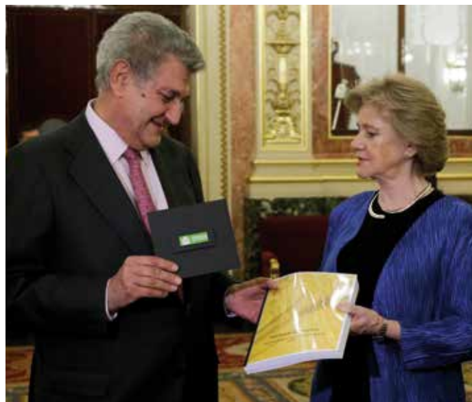
La Defensora del Pueblo, Soledad Becerril, entrega el informe al Presidente del Congreso de los Diputados, Jesús Posada.

Por ello, estima que la modificación de la norma debe interpretarse como una exención de licencia previa a los promotores de actividades comerciales inocuas; pero pide a los Ayuntamientos que no se consideren eximidos de su responsabilidad de control y de supervisión del cumplimiento de las normas ambientales, que no hayan quedado modificadas ni derogadas por las nuevas disposiciones liberalizadoras. ★