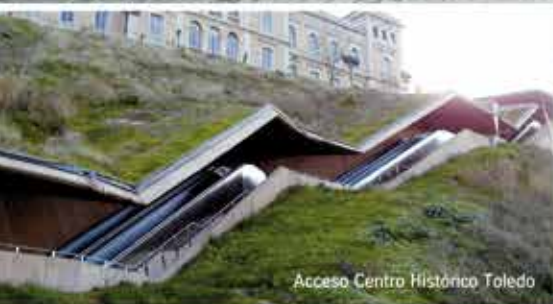
Acceso Centro Histórico Toledo