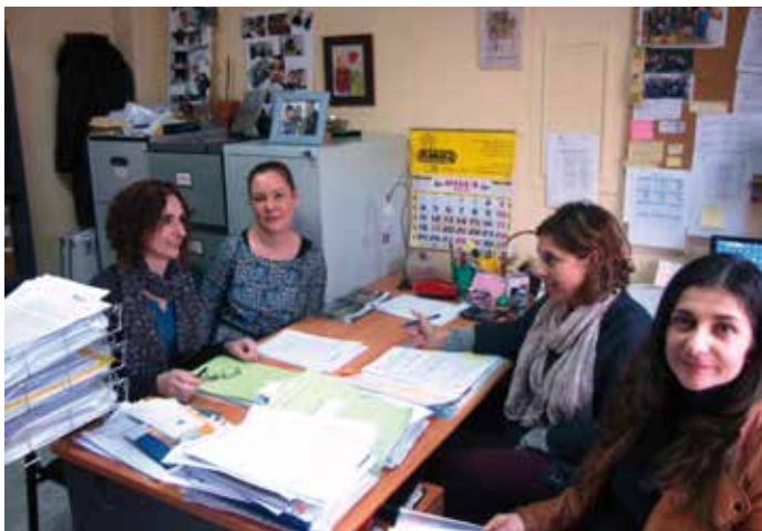
Servicio de Atención a la Mujer del Ayuntamiento de Cuntis.

El proyecto HERA del Ayuntamiento de Valencia fue seleccionado por la Comisión Europea en 2010 en el marco de su Programa Daphne III, cuya finalidad es combatir la violencia contra niños, jóvenes y mujeres. Liderado por la Policía Local, se han desarrollado durante los años 2011 y 2012, durante los cuales se ha estudiado y comparado los protocolos de actuación policial en materia de violencia de género en los siete países europeos participantes, se han extraído las buenas prácticas detectadas, y se ha formado a los policías y víctimas en el marco de dichas buenas prácticas, además de proponer reformas legislativas