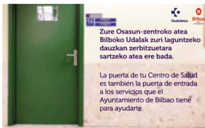
La colaboración con los centros de salud es una de las líneas de trabajo de la buena práctica premiada del Ayuntamiento de Bilbao.

de actuación del servicio telefónico de atención y protección para víctimas de la violencia de género (ATENPRO).