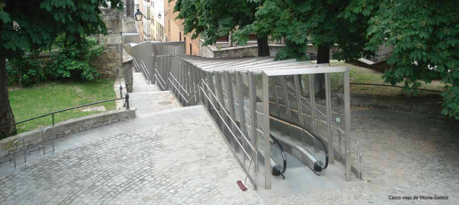
Casco viejo de Vitoria-Gasteiz