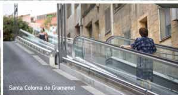
Santa Coloma de Gramenet