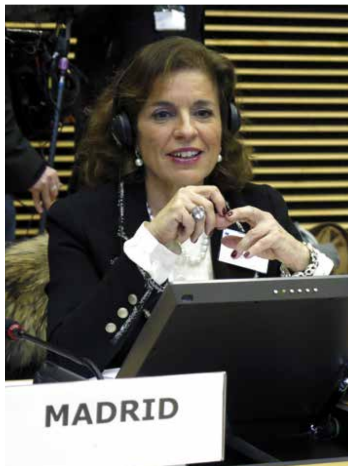
La Alcaldesa de Madrid, Ana Botella, durante el encuentro.

Además de los mencionados, la cita con los Alcaldes contó con la participación del Comisario de Medio Ambiente, Janez Potocnik, que compartió con los ediles sus puntos de vista sobre el crecimiento verde en el contexto urbano. En su intervención explicó cómo el potencial de ahorro energético e innovación de unas ciudades respetuosas con el medio ambiente puede mejorar la vida de los ciudadanos y aumentar la competitividad. En este sentido, recordó que la Comisión ha presentado diversas propuestas para fomentar la realización de inversiones en las zonas urbanas dentro del marco de la reforma de la política de cohesión que actualmente se está debatiendo. ★