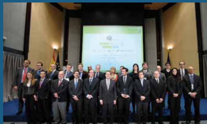
Representantes de las entidades premiadas

Recibieron, a su vez, menciones especiales como referentes en Interoperabilidad , el Plan PICAS del Ayuntamiento de Catarroja (Valencia) y el portfolio de soluciones SCSPVI del Ministerio de Hacienda y Administraciones Públicas.